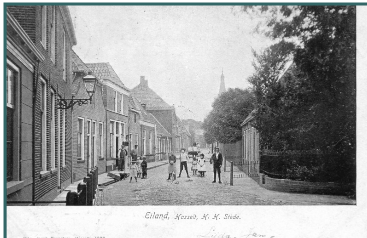
Eiland, Hasselt, H. H. Stede.

Op deze foto, die van voor 1919 dateert, is daar nog niets van te merken. Het is nog de tijd van voor de aanleg van de bovengrondse elektriciteitsleidingen. De lantaarn links zal