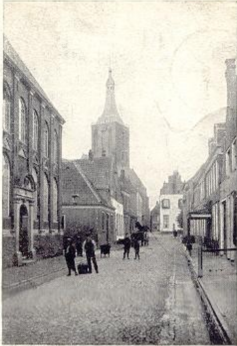
Uitgave van M. Bolkestein, Hasselt. NIEUWSTRAAT, HASSELT.