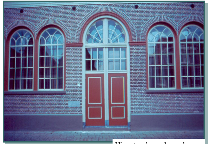
Hier stond voorheen de school in de Nieuwstraat

ging in het jaar daaropvolgend van een nieuwe instelling voor meisjes, kon de neergang niet keren en in 1884 volgde dan