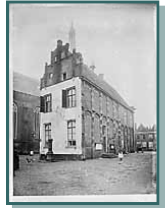
Stembureau in 1797

Voortaan mocht iedere man die qua leeftijd ervoor in aanmerking kwam zijn stem uitbrengen. Voor Hasselt had dit meteen grote gevolgen. Hadden er in 1917 voor de herziening in totaal 425 mannen stemrecht, na de grondwetswijziging werden dit er 617. Bij die laatste districtenverkiezing mochten in Hasselt 325 kiezers stemmen op grond van de door hen betaalde belasting, twaalf vanwege het bezit van een huis, 46 op grond van hun dienstbetrekking, vier vanwege het hebben van een spaartegoed en twee omdat zij met succes een examen hadden afgelegd. Een paar jaar later werd door de invoering van het algemeen vrouwenkiesrecht dit aantal praktisch nog eens verdubbeld.