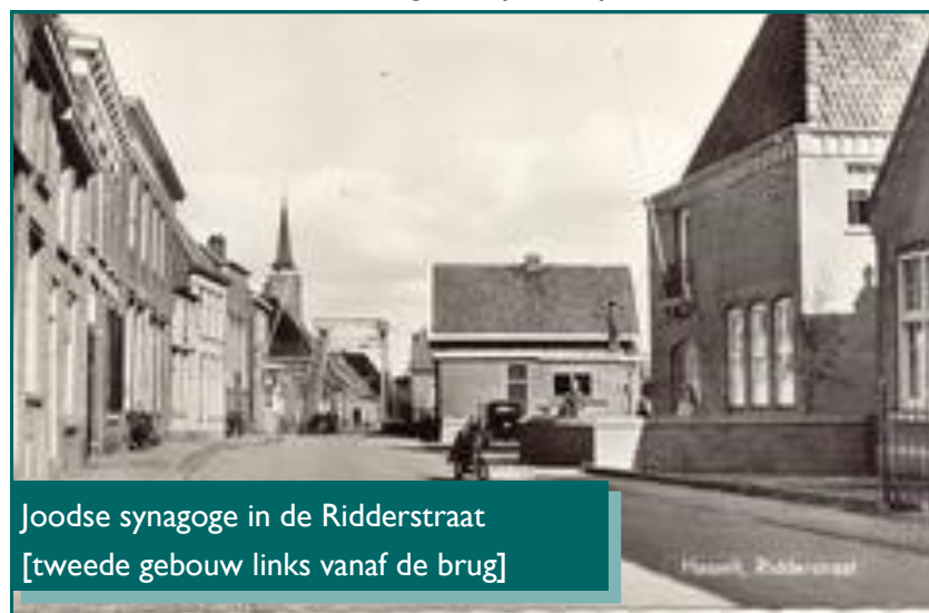
Joodse synagoge in de Ridderstraat [tweede gebouw links vanaf de brug]