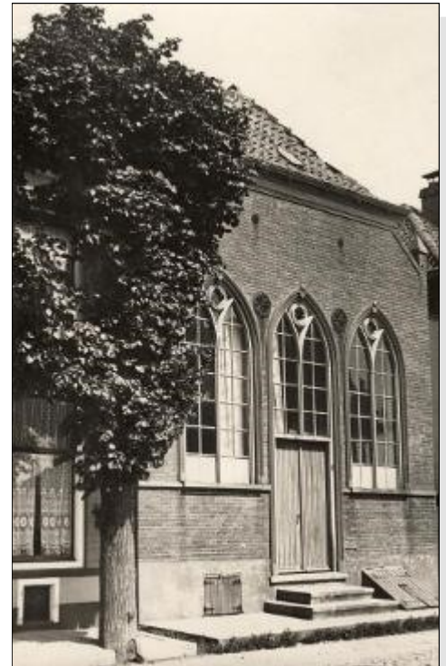
Joodse synagoge in de Ridderstraat

een supermarkt. Op het gedenkteken op de Markt herinnert een klein zinnetje - gedenk het leed van onze joodse stadsgenoten (als ware het een voetnoot) - nog aan het voorbij bestaan van een kleine, maar kenmerkende bevolkingsgroep in Hasselt. Hun namen worden helaas niet vermeld.