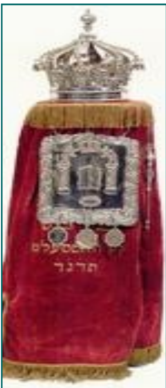
Tora mantel met kroon uit de Hasselter synagoge