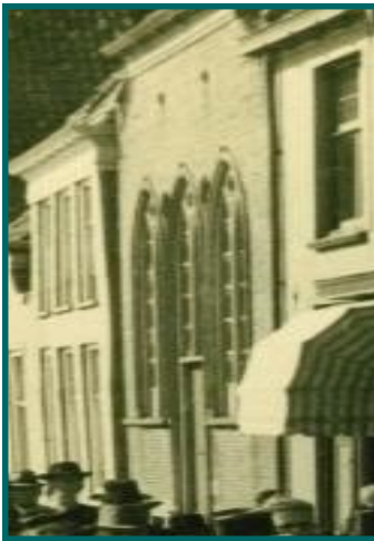
De synagoge in de Ridderstraat

Joden werden in het verleden veelal als een aparte bevolkingsgroep beschouwd. Vaak werden ze daardoor dan ook vervolgd. Soms werd zo'n vervolging gerechtvaardigd door naar de Bijbel te verwijzen.