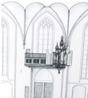
Het Covelensorgel 1514—1582 Nationaal orgelmuseum

J. Holthuis, Een kerk en haar orgels. De Stephanuskerk in Hasselt (Hasselt 2025). A.H. Vlagsma, Overisselse orgels uit de periode 1450 tot 1825 (Elburg 2022). H. van der Weel, Klokkenspel. Het Carillon en zijn bespelers tot 1800 (Hilversum 2008). H.B. van der Weel, Francois en Pieter Hemony, Stadsklokken- en geschutgieters in de Gouden eeuw (Hilversum 2018). Collectie Overijssel, toegangsnummer 1365.1, archiefnr. 64. Het Rudolph Knol orgel van de Stephanuskerk te Hasselt (Hoevelaken 2007).