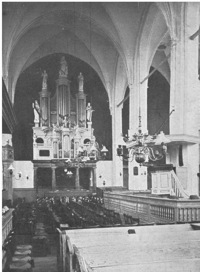
N. Herv. Kerk te Hasselt.