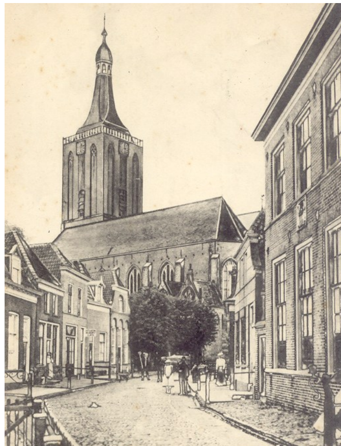
Eerste gebouw rechts. Armen en Weezenhuis in de Ridderstraat

De bouw van het weeshuis had blijkbaar het nodige gekost, want in 1586 moest de magistraat een geldlening hiervoor aangaan. In een archiefstuk uit 1588 wordt ook duidelijk dat het weeshuis in de Hoogstraat heeft gestaan. Daar waar deze straat een knik maakt zou aan de westzijde nabij de daar gelegen steeg de instelling hebben gestaan. Deze door-