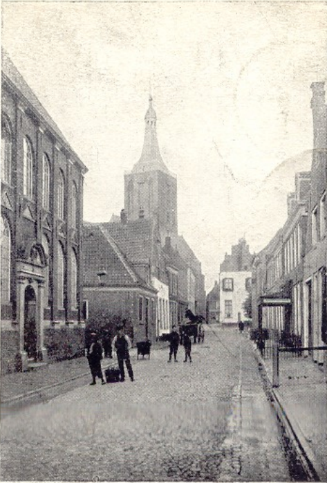
Uitgave van M. Bolkestein, Hasselt.