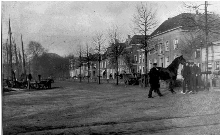
De paardenmarkt.

leidden tot een nieuwe activiteit. Eduard begon voor eigen rekening met de verkoop van vee en paarden. Ook nu weer was het Duitse leger de voornaamste afnemer. De vraag was zo groot, dat ze naast de Zwolse veemarkt ook die