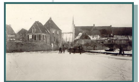
Ingang gracht. De panden staan op de kademuren