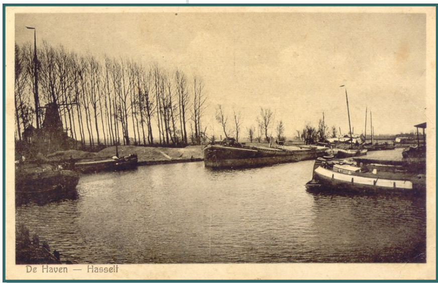
De Haven — Hasselt

De schuren links, die hier voorheen stonden zijn blijkbaar gesloopt en door andere vervangen.